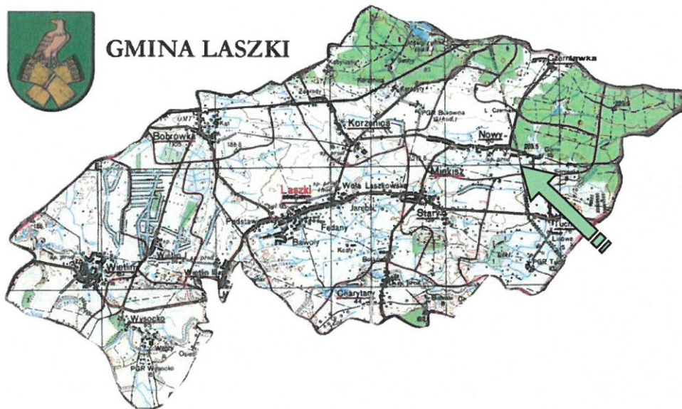
Tabela 4 3 Usytuowanie miejscowości Mięksisz Nowy w Gminie Laszki

Sołectwo zajmuje powierzchnię 14,43 km 2 . W części wschodniej i północnej zlokalizowane są tereny leśne, z przewagą sosny i buka. Sołectwo zamieszkuje 657 mieszkańców. Na terenie Mięksisza Nowego występują nieco lepsze piaski gliniaste, gleby kwaśne o dość małej zawartości części próchnicznych. Powierzchnia mienia wiejskiego liczy ogółem 147,52 ha, z czego pastwiska i grunty orne zajmują powierzchnię 50,89 ha, a lasy i grunty zalesione – 69,50 ha.