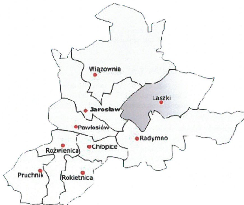
Rysunek 2 Usytuowanie Gminy Laszki w Powiecie Jarosławskim

Gmina Laszki liczy 6993 mieszkańców (wg GUS - stan na dzień 31 grudnia 2016 r.). Gmina należy do gmin rolniczych. Na terenie Gminy funkcjonują dwa Rolnicze Zespoły Spółdzielcze oraz jedna Rolnicza Spółdzielnia Produkcyjna a także 1300 gospodarstw indywidualnych (dane własne UG Laszki). Średnia wielkość gospodarstw wynosi 5,60 ha.